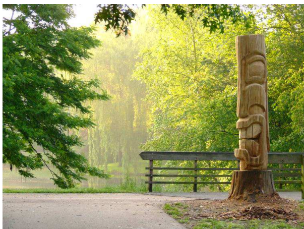
Groen in de wijk