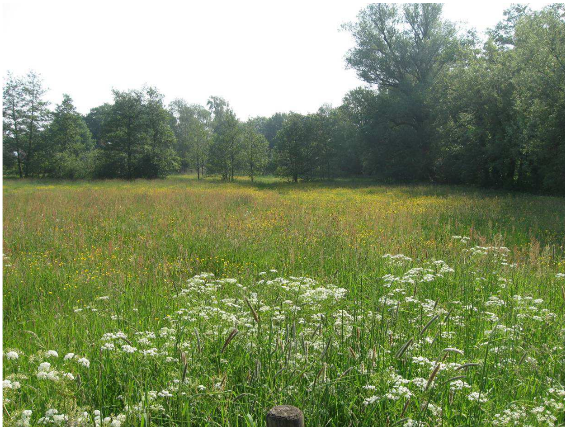
Extensief beheerd graslandje in Hengelo

Hoewel het leuk staat, is het af te raden de bermen en graslanden in te zaaien met bloemenmengsels. De soorten die zich van nature ontwikkelen kunnen hierdoor worden verdrongen. Dat geldt dan ook weer voor de insecten, vlinders, vogels en kleine zoogdieren die hier volgens de natuurlijke orde thuishoren.