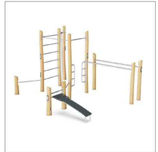
Nieuw beweegtoestel Kompan Robinia combi 4 (FRO 104)