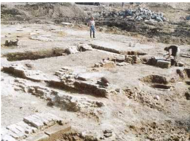
huisplaats Huys Hengelo

De status van gemeentelijk monument geeft de noodzakelijke bescherming aan deze voor Hengelo unieke en zeldzame archeologische vindplaats die van grote cultuurhistorische waarde is. Na veel onderzoek is nu bekend welke vondsten zich waar bevinden onder het maaiveld. De vindplaats moet verder ongemoeid blijven. Terecht heeft de gemeenteraad het concept bestemmingsplan van 1995 aangepast aan de actualiteit van de opgravingen. In het definitieve bestemmingsplan Thiemsland van juli 1997 is een belangrijke - zelfs boven regionale - functie toebedacht aan de als 'archeologische vindplaats' omschreven locatie. Dit is echter niet geformaliseerd door plaatsing op de gemeentelijke monumentenlijst. Het ligt voor de hand om plaatsing nu alsnog te honoreren.