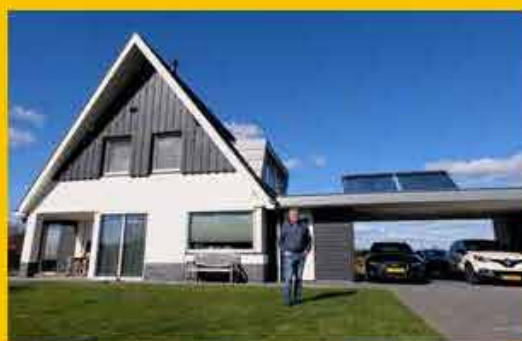
Een energieneutraal huis aan de Schalmedenweg

Meer dan de helft van de Hengelose huishoudens maakt in 2030 gebruik van duurzame energie van windturbines en zonnepanelen. Energie die we in de gemeente Hengelo zelf opwekken. Het is een grote operatie die we samen met onze inwoners, ondernemers en de andere Twentse gemeenten uitvoeren. Maar we doen het niet voor niets. We moeten met z'n allen minder CO2 uitstoten om de klimaatverandering tegen te gaan. Daarom moeten we overal in het land, maar ook in de landen om ons heen in actie komen.