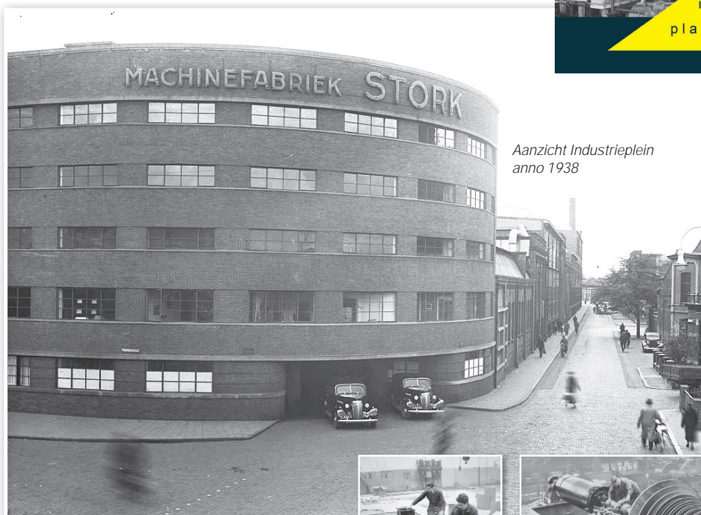
Aanzicht Industrieplein anno 1938