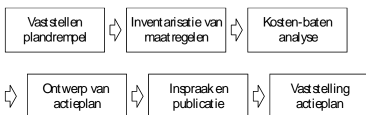
Figuur 5.1: Totstandkoming actieplan

Het opstellen van actieplannen kan worden gestructureerd in de hiernavolgende zes project-stappen.