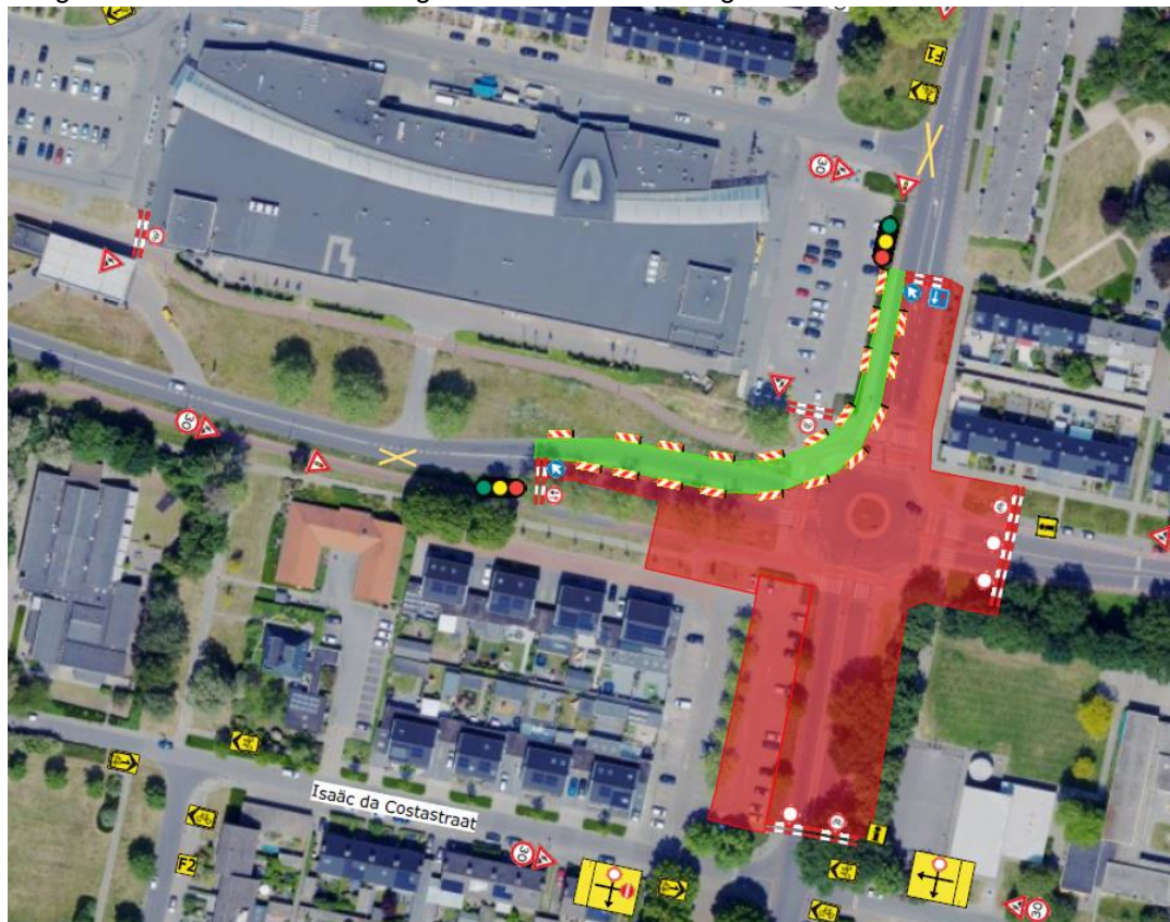
Figuur 1, het werkgebied van fase 3 is rood gearceerd en de tijdelijke route is groen gearceerd.

Om de hinder te minimaliseren en uw bereikbaarheid zo goed mogelijk te waarborgen wordt er in verschillende fases gewerkt. In deze brief concentreren wij ons op fase 3. Deze fase betreft de rotonde Staringstraat-P.C. Hooftlaan en een gedeelte van de parkeerplaats aan de Isaac Da Costastraat. In figuur 1 hieronder is het werkgebied van fase 3 rood gearceerd: