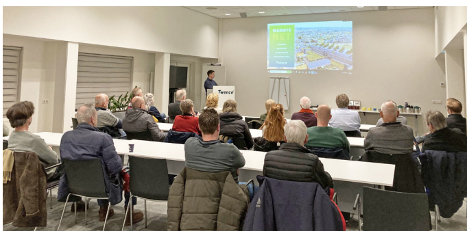
Rondleiding bij Twence

Begin dit jaar zijn er verschillende bijeenkomsten geweest over Hengelo aardgasvrij en het warmteprogramma. Ook Twence was daarbij aanwezig om uitleg te geven over warmtenet. Zowel in het stadhuis als in de Nijverheid konden mensen zich aanmelden voor een rondleiding bij Twence. 53 inwoners uit de Nijverheid en 't Genseler hebben daar gebruik van gemaakt. De meeste mensen vonden het erg fijn om een kijkje in de keuken te krijgen.