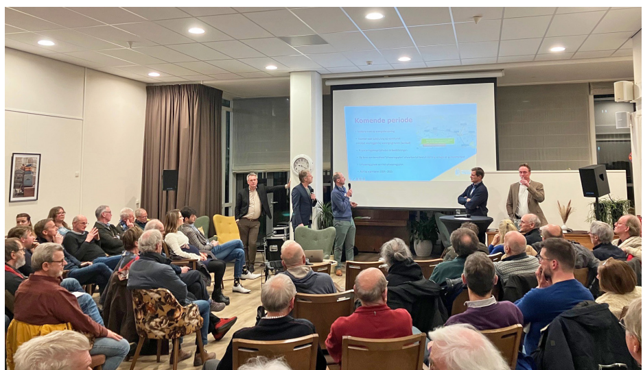
Bijeenkomst Wijkhuys Nijverheid in De Kloksteen

Om te beginnen is een grote warmtebron zoals Twence belangrijk om van start te kunnen met het warmtenet, omdat er nu al veel warmte beschikbaar is. Deze warmte is afkomstig uit meerdere installaties binnen Twence. Bij Twence wordt afval verbrand. Alleen afval dat niet opnieuw te gebruiken is, komt in aanmerking om verwerkt te worden in de Twence energiecentrales. Het zou mooi zijn als al ons afval gerecycled zou kunnen worden. Maar dat is, zeker de komende tientallen jaren, niet realistisch. Daarnaast wordt er steeds minder afval gestort op grote stortplaatsen, waardoor er meer afval verbrand wordt. Mocht de afvalberg in de komende tientallen jaren teruglopen, kunnen op termijn alternatieve energiebronnen worden aangesloten op dit open warmtenet.