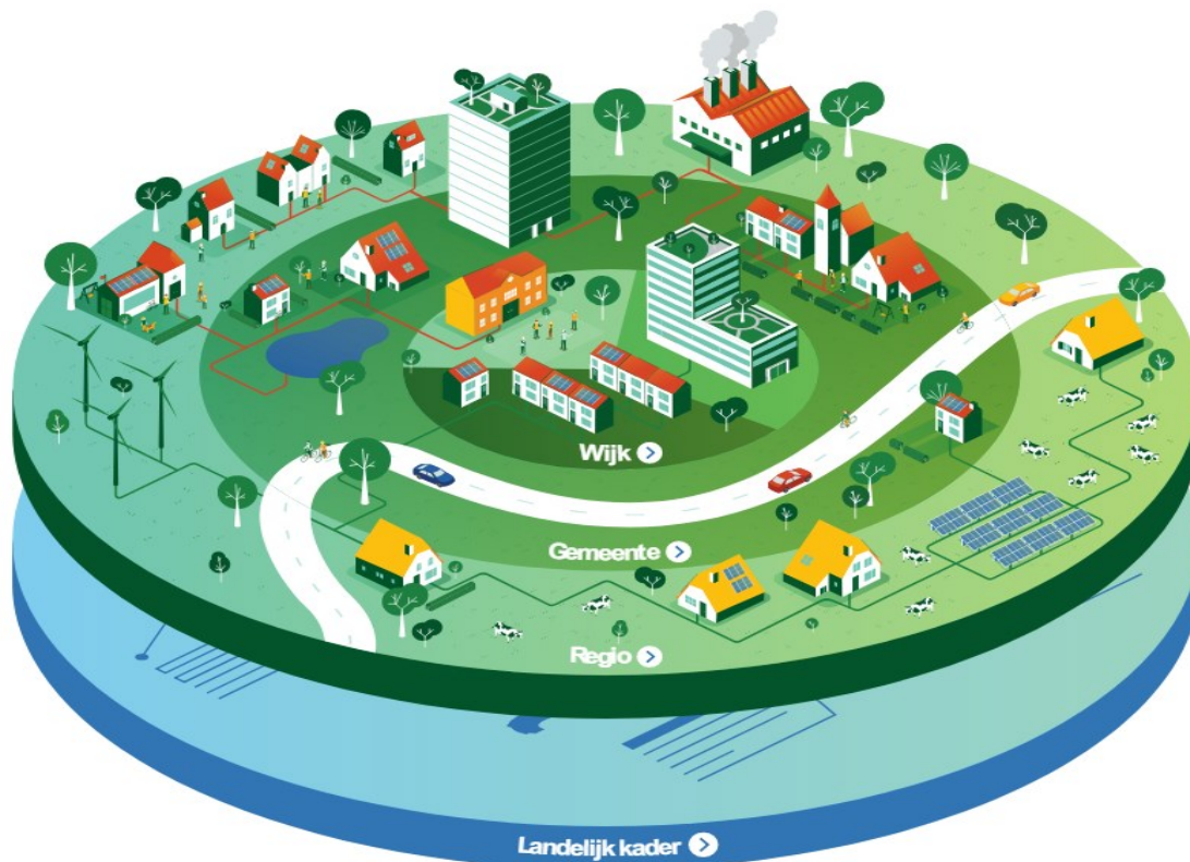
Figuur 1 Schaalniveaus van het Klimaatakkoord

Gemeente. Omdat we ook voor onze kinderen en kleinkinderen een gezond, groen en energieneutraal Hengelo willen, willen we afscheid nemen van het gebruik van fossiele brandstoffen. Omdat in de meeste huishoudens nu nog een aardgasfornuis staat en de woningen verwarmd worden met aardgas CV-ketels zal de volledige overstap naar duurzame warmtebronnen een flinke uitdaging zijn. Om Hengelo echt aardgasvrij te maken zullen we met zijn allen moeten samenwerken: inwoners, woningcorporaties, energieleveranciers, netbeheerders, bedrijven en de gemeente. Ook betekent aardgasvrij dat de gebouwen technisch aangepast worden en dat ons gedrag moet veranderen. In de Transitie Visie Warmte zal ingegaan worden op de verschillende manieren van verduurzamen, welke van deze manieren het beste passen bij de verschillende wijken, hoe de financiering en betaalbaarheid geregeld zal worden, hoe de participatie en communicatie plaats zullen vinden en wie welke rol heeft in de uitvoering. De TVW zal elke vijf jaar herzien worden om in te kunnen spelen op nieuwe ontwikkelingen. Figuur 2 geeft dit schematisch weer, ook in relatie tot de RES.