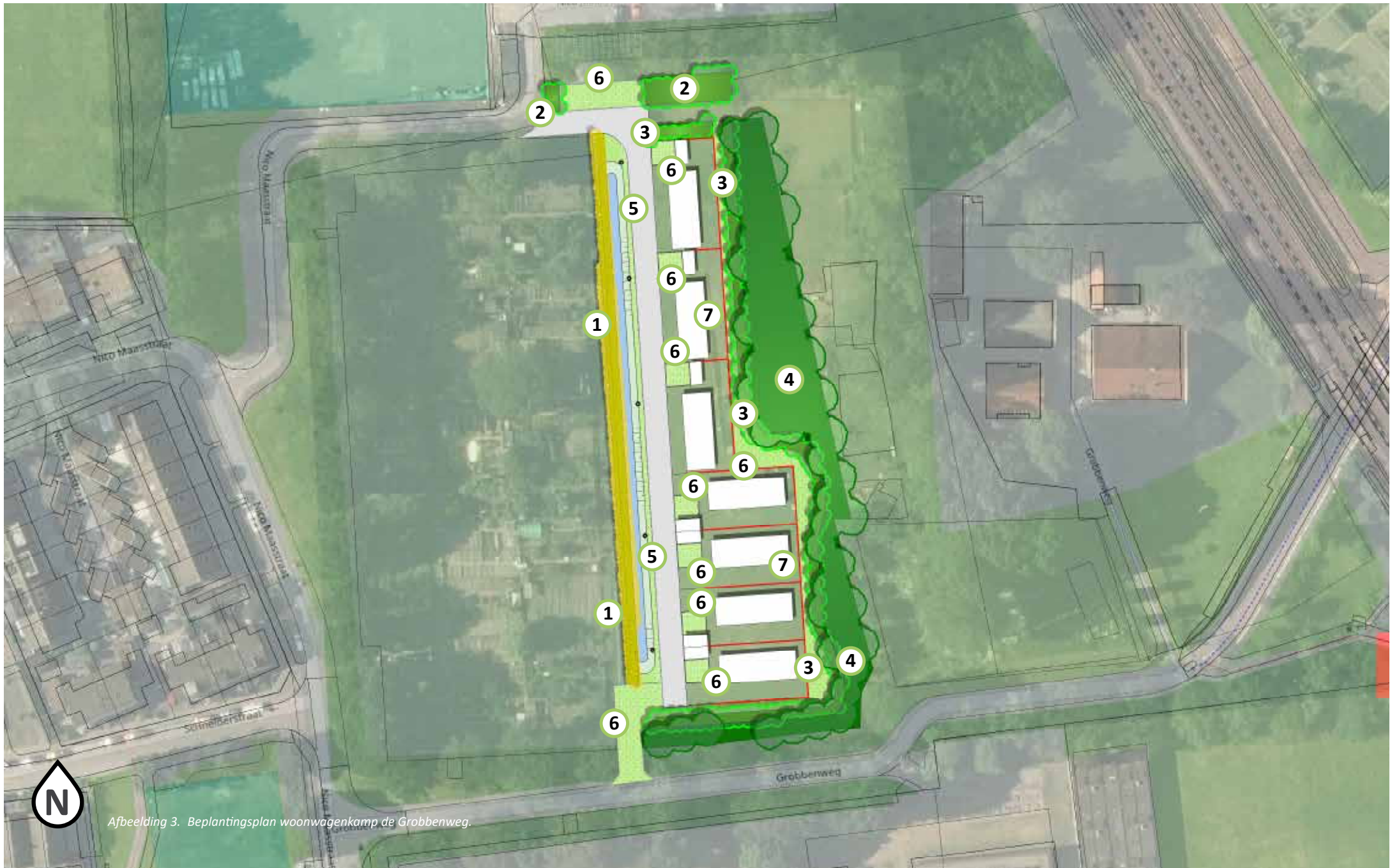
Afbeelding 3. Beplantingsplan woonwagenkamp de Grobberweg.