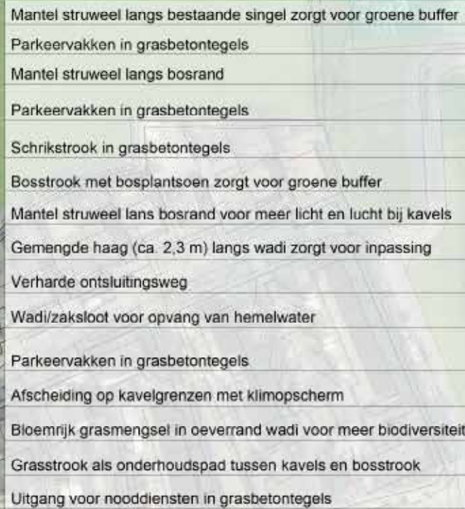
Afbeelding 2. Landschappelijke inpassing woonwagenkamp bij de Grobbenweg.