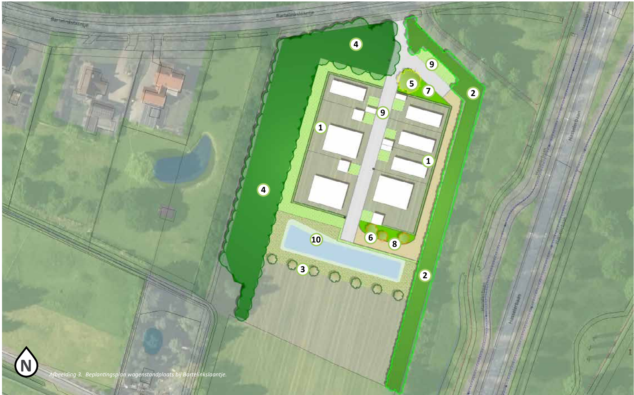
Afbeelding 3. Beplantingsplan wagenstandplaats bij Bartelinkslaantje.