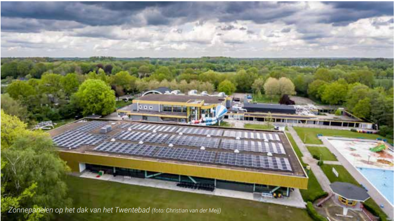
Zonnepanelen op het dak van het Twentebad