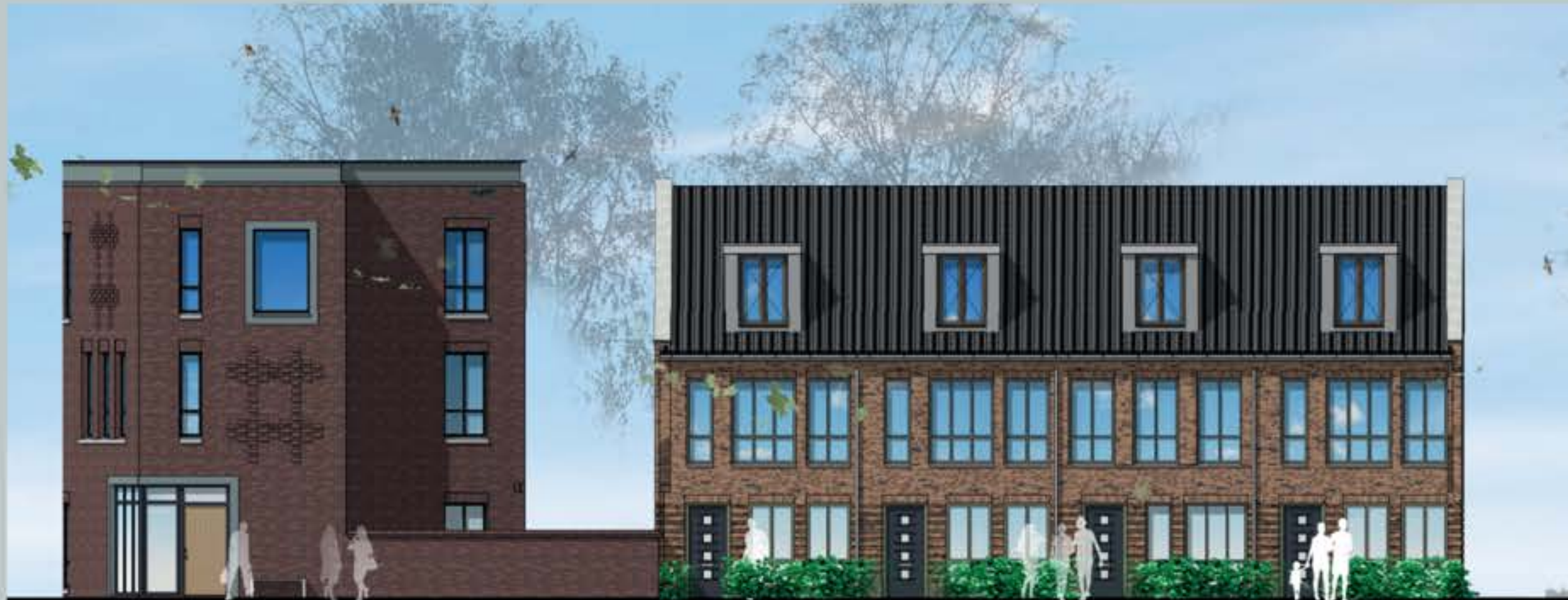
Straatbeeld de Clercqdwarsstraat

Voortuinen worden afgescheiden met een groene haag