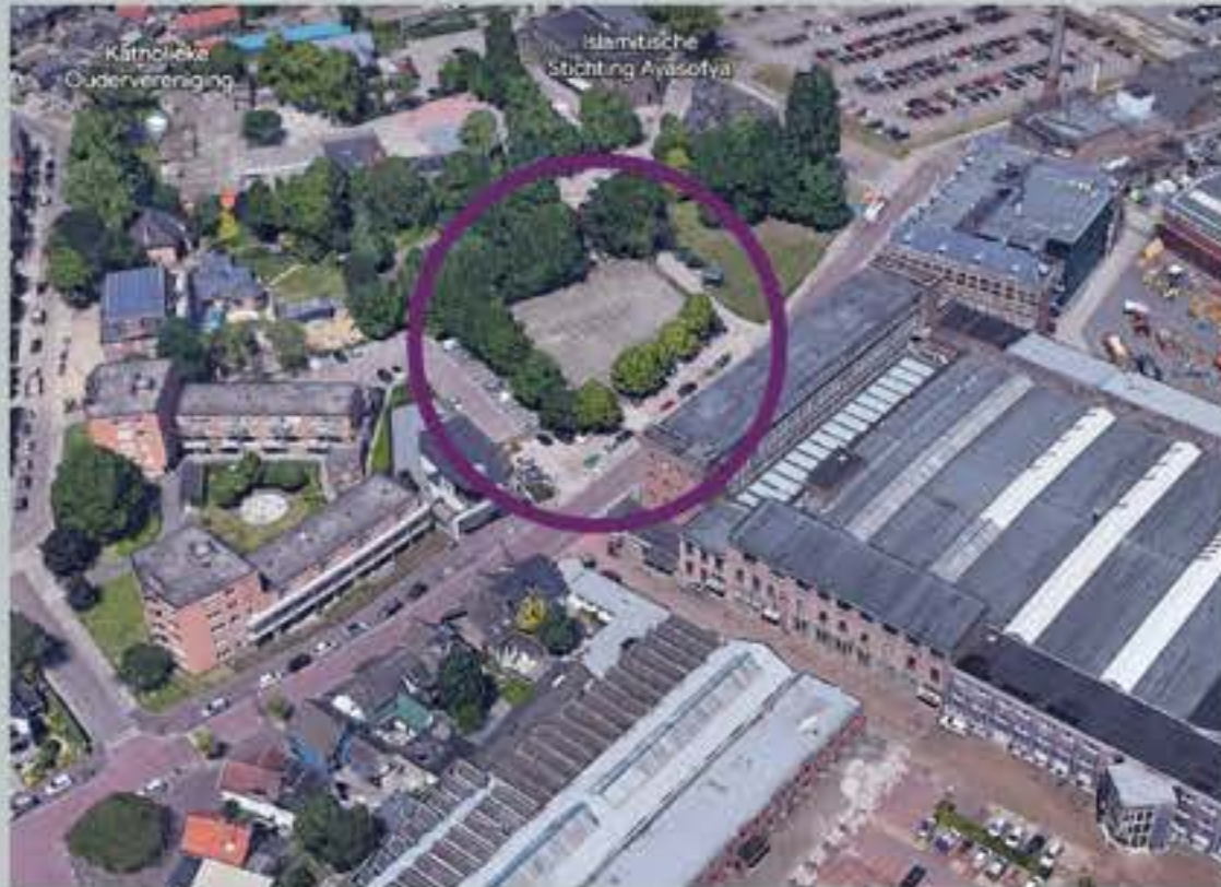
De Hofmakerij 2